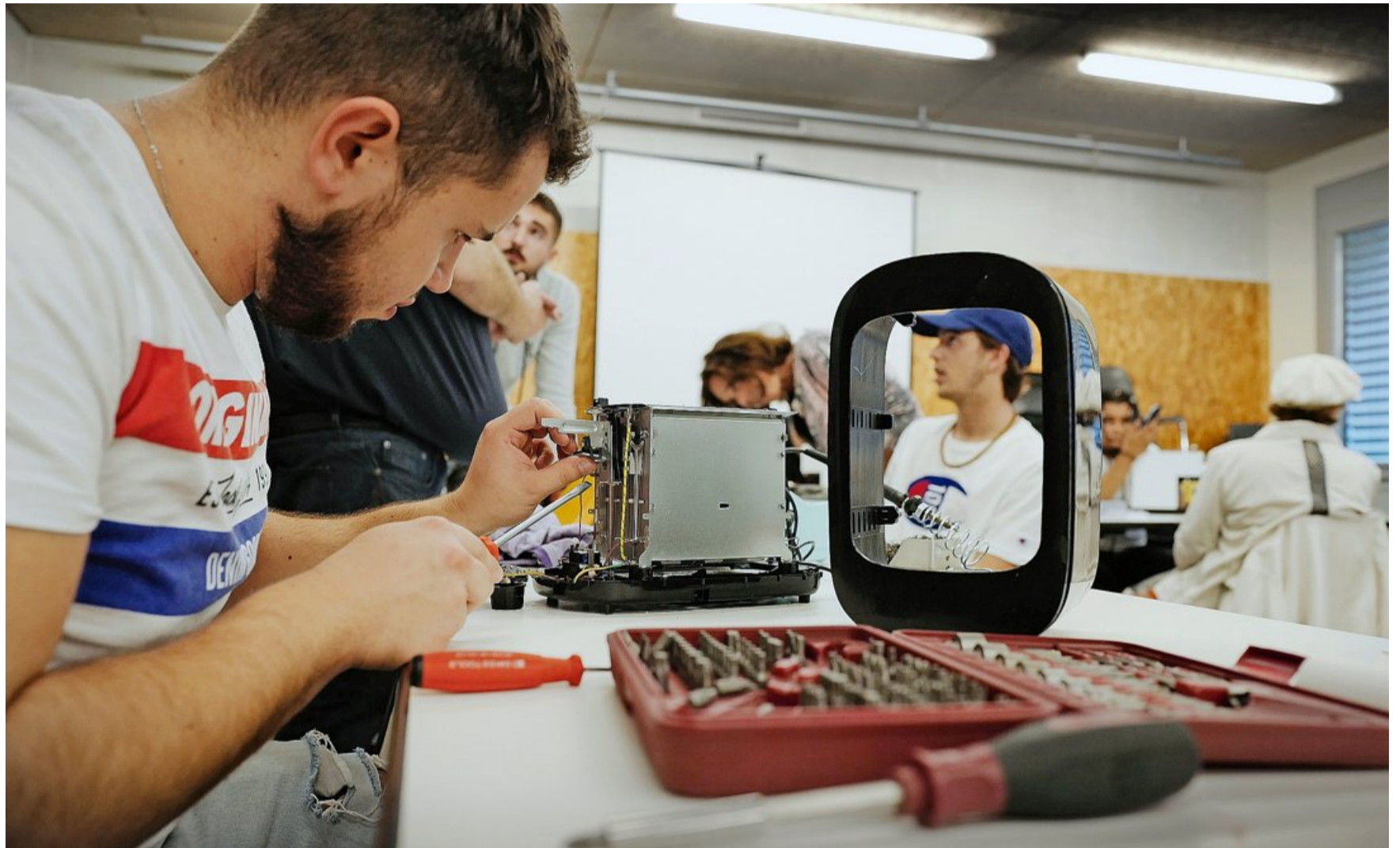
Les élèves du Centre de formation professionnelle technique de Genève qui participent à cet atelier évitent ainsi un énorme gaspillage.

La démarche ici est simple: il faut envoyer un mail à surb@carouge.ch ou téléphoner au 022 307 89 12, en mentionnant son adresse, son numéro de téléphone et le type d'appareil à réparer. Puis, le jour J, on se rend sur place avec celui-ci, et les élèves du CFPT bricolent devant vous, sous la surveillance de leur professeur d'atelier.